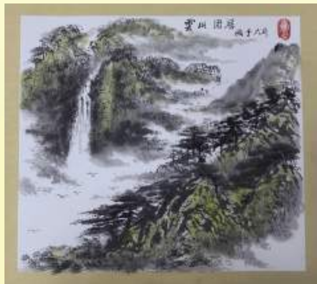
孔宪玉《云山固居》绘画类第三名